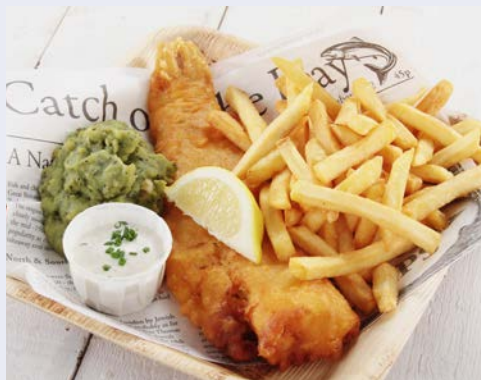
Fish & Chips – einfach lecker!