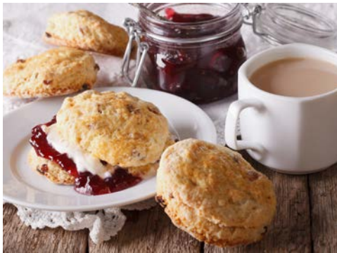
Scones mit Cream Tea – einfach lecker

Das Hotel Pomme d'Or (Landeskategorie: 4 Sterne) ist direkt im Herzen von St. Helier gelegen und somit ein idealer Ausgangspunkt für Erkundungen. Vom Hotelrestaurant aus genießen Sie den wunderschönen Blick über den Liberation Square bis hin zum Yachthafen. Das Hotel verfügt über das „Harbour Room“ Restaurant sowie eine Café-Bar in der Stadt. Sie können außerdem die Badelandschaft des rund 15 Gehminuten entfernten Schwester-Hotels „The Merton“ kostenfrei nutzen (bei Interesse wenden Sie sich bitte an die Rezeption des Pomme d'Or). Die Zimmer sind komfortabel und mit LCD-TV, Telefon, Klimaanlage sowie einem Kaffee-/Teezubereiter, Bad und Haartrockner ausgestattet.