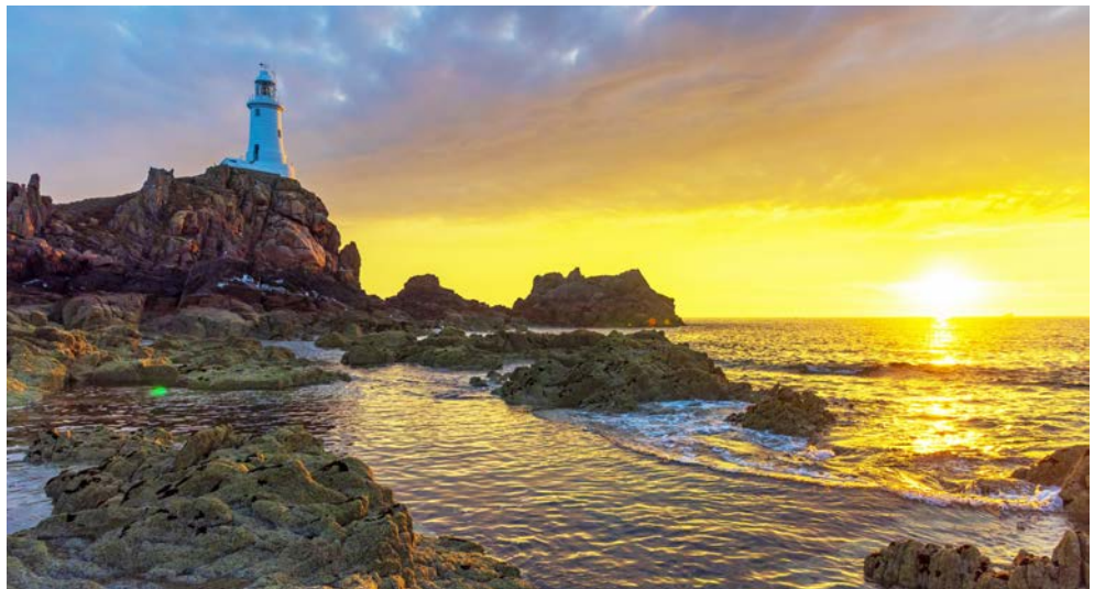
Leuchtturm La Corbière