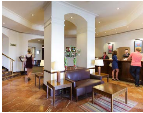
An der Rezeption

Zahlungsmodalitäten: 20% Anzahlung des Reisepreises bei Buchung. Restzahlung bis 30 Tage vor Reiseantritt.