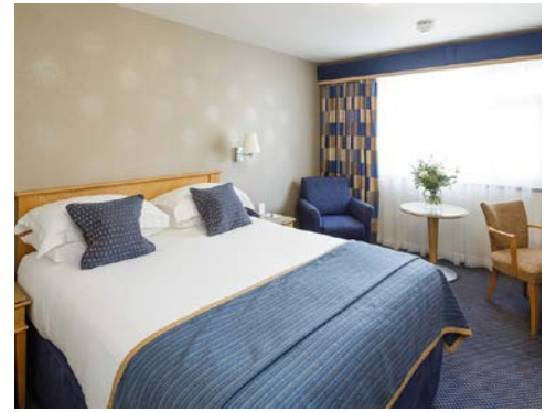
Zimmerbeispiel im Hotel

Reisevermittler: Hanseat Reisen GmbH, Langenstraße 20, 28195 Bremen.