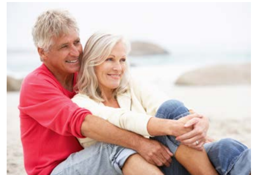
Genießen Sie die Aus- und Augenblicke

Jersey Cream Fudge!). Der Nachmittag steht zu Ihrer freien Verfügung. Empfehlenswert ist ein Besuch der Festungsanlage Elizabeth Castle, die Sie von St. Helier aus gezeitenabhängig bequem zu Fuß oder mit einem Amphibienfahrzeug erreichen können. Für Geschichtsinteressierte bietet sich der Zusatzausflug zu den War Tunnels an: In dieser mehrfach preisgekrönten Ausstellung wird die Besatzungszeit durch deutsche Truppen während des zweiten Weltkriegs mit Original-Mobiliar, Ton- und Bilddokumenten in bewegender Weise lebendig.