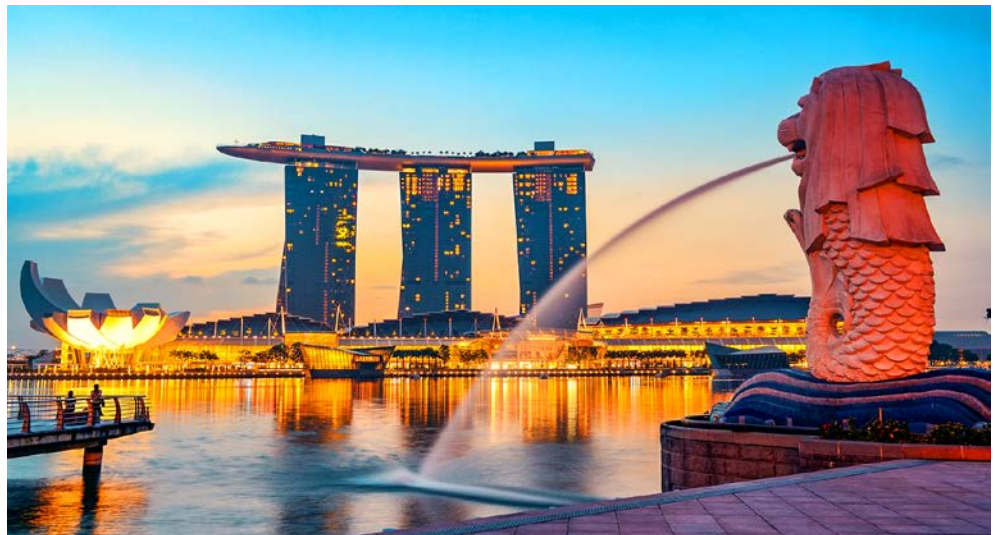
Freuen Sie sich auf das Vorprogramm in Singapur