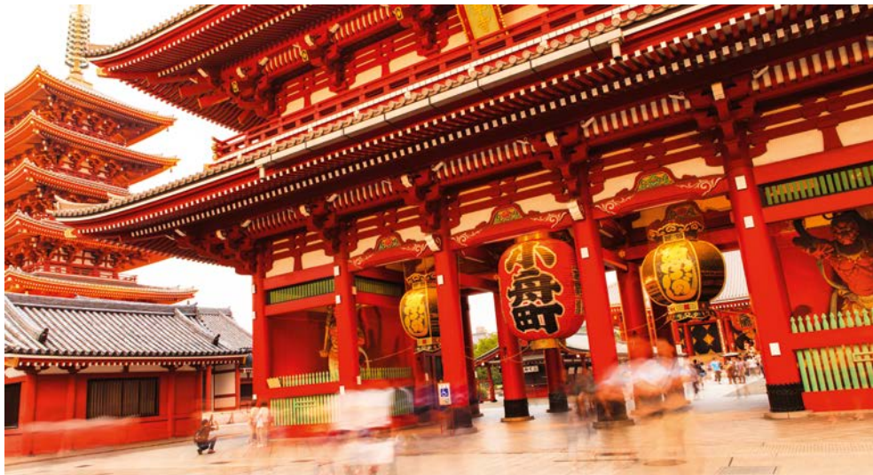
Stadtrundfahrt Tokio inklusive