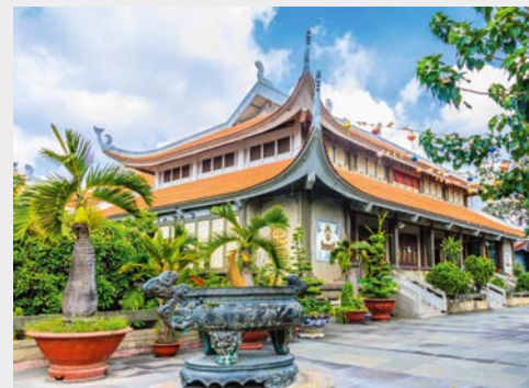
Ho Chi Minh City