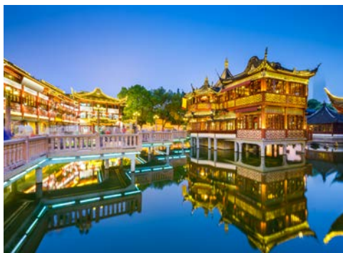
Shanghai, Yuyuan Gardens

Märkten oder der ruhige Yu-Garten, der noch aus der Ming-Zeit stammt und eines der schönsten Beispiele traditioneller chinesischer Gartenbaukunst darstellt, sind sehr sehenswert.