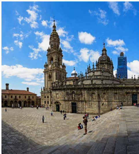
Kathedrale in Santiago de Compostela