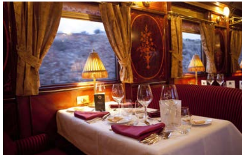
Restaurant an Bord