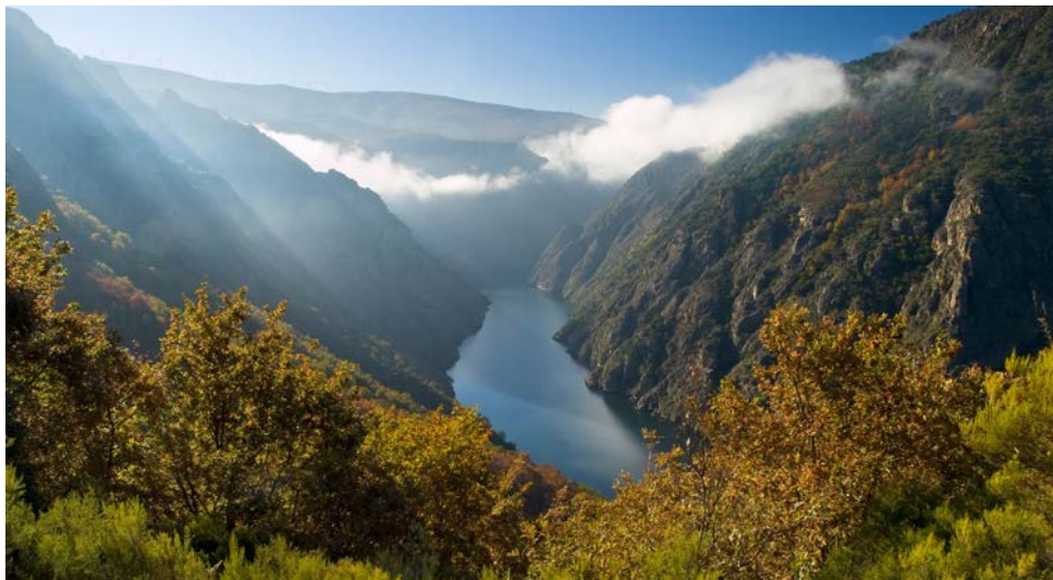
Der eindrucksvolle Sil-Canyon

Kastilien-León nach Ávila (UNESCO-Weltkulturerbe), dessen gewaltige Befestigungsanlage aus dem 11. Jh. zu den besterhaltenen mittelalterlichen Stadtbefestigungen weltweit zählt. Die Stadtmauern umschließen ein wahres Kleinod an Kunst. Auf engstem Raum ballt sich auf 1.128 m Höhe zusammen, was Kastilien so schön macht: Gotische Herrenhäuser, verwinkelte Gassen, großartige romanische Kirchen und nicht zu vergessen das Wahrzeichen der Stadt, die imposante 2,5 km lange Stadtmauer mit ihren 28 mächtigen Türmen sind Zeugnisse der unvergleichlichen Geschichte Ávilas. Am Nachmittag erreicht Ihr Sonderzug Astorga. Von hier aus führt Sie ein kurzer Ausflug zur geschichtsträchtigen Bischofsstadt León, einem der bedeutendsten Etappenziele der Jakobspilger auf dem Weg nach Santiago de Compostela. Ein Muss in León: Ihr Besuch der gotischen Kathedrale, die sich unübersehbar mit den fast 70 m hohen Türmen über die Plaza de Regla erhebt. Weiterfahrt mit dem Al Ándalus hinein in die grünen Berge Galiciens nach Monforte de Lemos. (F, M, A)