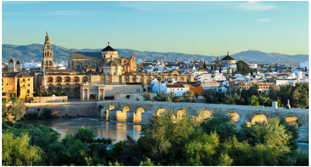
Stadtpanorama von Córdoba

Spanien, beeindruckender Schmelztiegel morgenländischer und abendländischer Kulturen, ist eines der faszinierendsten Länder der Welt. Ihre genussvolle Sonderzugreise mit dem legendären Al Ándalus, dem exklusiven Nostalgie-Zug im Stil der Belle Époque, führt Sie auf einer einzigartigen Route etwa 1.250 km von Andalusien über Kastilien bis in den Norden an Spaniens Atlantik-Küste nach Galicien. Einige der schönsten Städte Spaniens, wie Sevilla, Córdoba, Toledo, Ávila, León und Santiago de Compostela sind Höhepunkte Ihrer Reise. Lassen Sie sich von sechs UNESCO-Welterbestätten mit malerisch gelegenen Burgen, Klöstern und beeindruckenden Palästen inmitten historischer Stadtkerne verzaubern. Entdecken Sie verwinkelte Gassen, vielfältige kulturelle Facetten und historische Sehenswürdigkeiten. Exklusive Einblicke in die Kultur sowie exquisite mediterrane Gaumenfreuden runden Ihre komfortable Reise ab. Erleben Sie Spanien auf elegante und unvergleichliche Art und Weise!