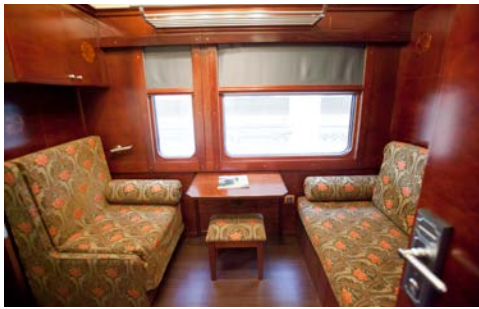
Gran Class Abteil