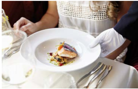
Genießen Sie exquisite Gaumenfreuden an Bord