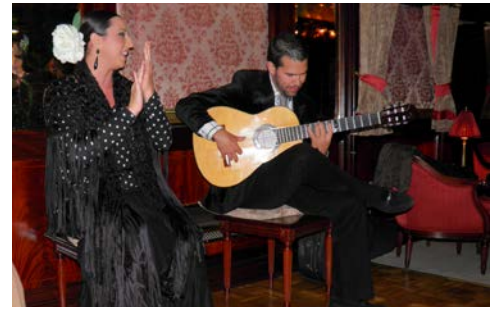
Unterhaltung an Bord