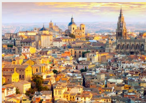
Blick über Toledo