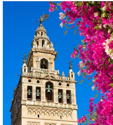
Giralda – das Wahrzeichen von Sevilla