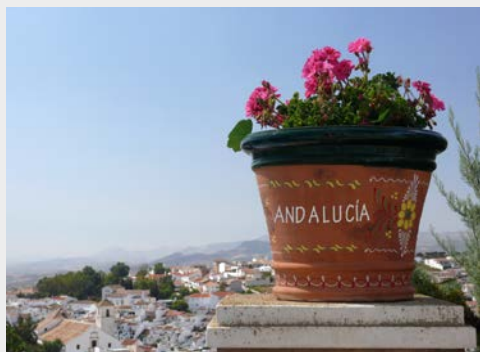
Willkommen in Andalusien!