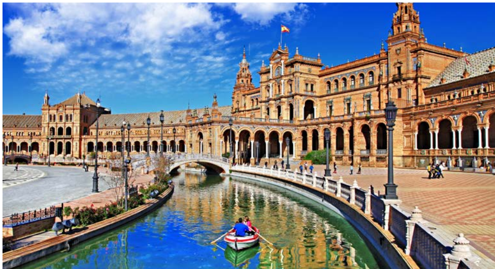
Traumhaft schönes Sevilla

Inneren der Mezquita geraten Besucher angesichts von 800 kunstvoll arrangierten Säulen ins Staunen. Bei einem Besuch der Synagoge Córdoba's lernt man zudem ein jüdisches Gotteshaus kennen, das auch für christliche Zwecke genutzt wurde. Der Rundgang durch die Altstadt führt durch schmale Gassen mit hübschen Innenhöfen. Auch das einstige jüdische Viertel Judería mit seinen Handwerksbetrieben und Tapas-Bars lädt zum Bummeln ein. Hier steht auch die berühmte Synagoge von Córdoba aus dem 14. Jahrhundert, die als einzige der zahlreichen Synagogen der Stadt nach der Vertreibung der Juden und Muslime im Zuge der Rückeroberung Spaniens verschont wurde. Nach der Führung bleibt Zeit, die Stadt individuell zu erkunden, bevor es zurück zum Hotel geht.