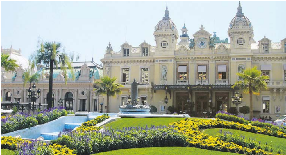
Das Spielkasino in Monte Carlo

Ihr Hotel thront, zum berühmten Yachthafen Port Hercule im Bezirk La Condamine. Bekannt ist Monaco aber vor allem für zwei imposante Bauten im Stadtteil Monaco-Ville: zum einen für den Fürstenpalast, von dem aus die Fürstenfamilie der Grimaldis die Geschicke Monacos lenkt, sowie für das Ozeanographische Museum. Eventuell statt Sie dem Haus einen Besuch ab. Am Abend treffen Sie sich zum gemeinsamen Abendessen und lassen den Tag Revue passieren.