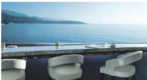
Blick von der Hotelterrasse

4-Sterne-Plus-Hotel Fairmont in Monte Carlo Im Herzen des Fürstentums, in der Nähe des legendären Kasinos gelegen, ist das Fairmont Monte Carlo mit über 600 Zimmern und Suiten eines der größten Hotels in Europa.