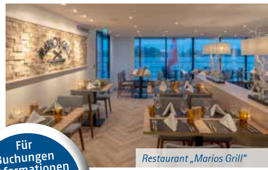
Restaurant „Marios Grill“