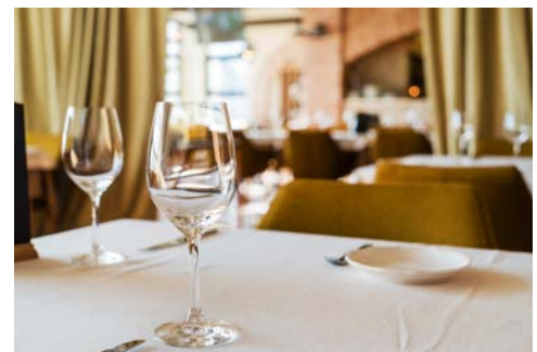
Im Sterne-Restaurant für Sie reserviert.