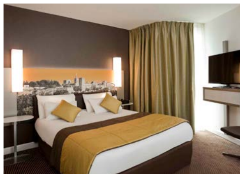
Beispiel – Hotelzimmer

Das Hotel Mercure Cité des Papes (Landeskategorie: 4 Sterne) liegt in unmittelbarer Nähe zum Place de l'Horloge, direkt am berühmten Papstpalast. Aufgrund der optimalen Lage sind zahlreiche Sehenswürdigkeiten schnell zu erreichen. Cafés, Restaurants und viele kleine Geschäfte befinden sich in der Nähe. Alle 73 Zimmer sind komfortabel mit Bad/WC, Fernseher, Telefon und Minibar ausgestattet. Die Zimmer der Kategorie Classic sind etwa 15qm groß und verfügen über ein Doppelbett (160x 200 cm) oder zwei Betten (jew. 100 x 200 cm). Zimmer der Superior-Kategorie sind ca. 21 qm groß und verfügen zusätzlich über ein Einzel-Schlafsofa (auf Anfrage gegen Aufpreis möglich).