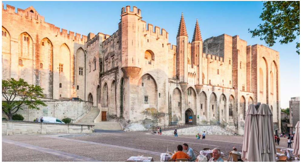
Papstpalast in Avignon

Entdecken Sie während dieser besonderen Reise die unterschiedlichen Genusspfade der französischen Küche. Mit den letzten warmen Sonnenstrahlen im Gepäck erkunden Sie die alte Papststadt Avignon, besuchen die bekannte Weinregion Châteauneuf-du-Pape und erleben einen der bekanntesten Trüffelmärkte Frankreichs im Dorf Richerenches. Immer samstags wird der „schwarze Diamant“ gehandelt. Gelagert im Heck der Autos der Trüffelbauern, transportiert in Plastiktüten und Sporttaschen, ausgebreitet auf Klappstischen, zeigt sich ein zeitweise skurriles „Handelsbild“ in den schmalen Straßen und Gassen. Erleben Sie das ursprüngliche Frankreich, abseits der touristischen Hotspots. Schnell wird bei den Besichtigungstouren deutlich, wie sehr französische Leichtigkeit und mediterraner Esprit das Leben in der Region bestimmen. Gerade in Städten wie Avignon und Aix-en-Provence zeigt sich Südfrankreich von seiner charmantesten Seite.