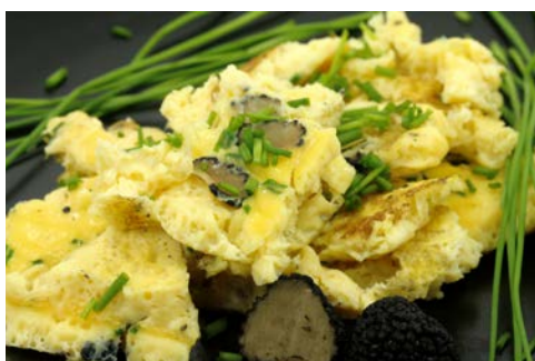
Exquisit – Trüffelomelette

Trüffelomelette „la Brouillade“. Zurück in Avignon steht Ihnen der Nachmittag zur freien Verfügung. Zeit für eigene Erkundungen.